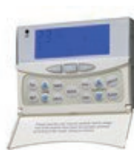
Pannello comandi centralizzato