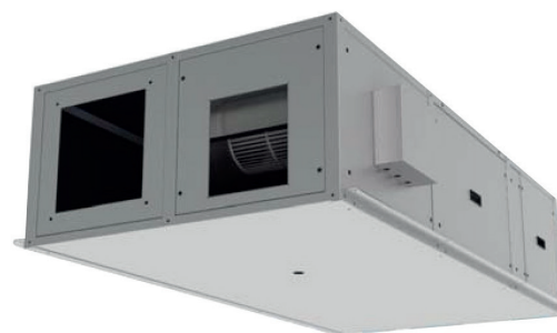
Recuperatore di calore HRS+